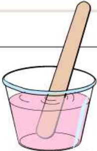
축광안료 + 전용본드